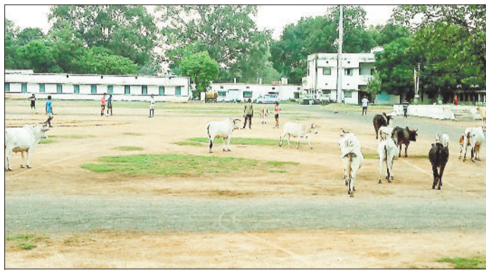
मिनी स्टेडियम में मवेशी।

जानकारी के अनुसार कुमार चौक, बाजारपारा व मुख्य मार्ग पर विचरण करने वाले पशुओं को नपा की टीम के द्वारा खदेड़ कर मिनी स्टेडियम में ले जाकर भर दिया जाता है, जहां स्टेडियम में मवेशी विचरण करते रहते हैं और कहीं पर बैठ जाते हैं, इस कारण खेलकूद व दौड़ लगाने वालों को दिक्कत होती है। वहीं रातभर मिनी स्टेडियम में मवेशियों के भर जाने के कारण खेल मैदान में सुबह होने पर जगह-जगह गोबर हो जाता है, इसके कारण भी सुबह खेलकूद करने वालों एवं मॉर्निंग वॉक करने वालों को दिक्कतों का सामना करना पड़ रहा है। शहर की सड़कों को पशु मुक्त करने की दिशा में नपा द्वारा अधिकारियों-कर्मचारियों की टीम बनाई गई है, लेकिन दिनभर शहर क्षेत्र में पशु विचरण करते रहते हैं, इससे कि शहर क्षेत्र के विभिन्न मार्गों में