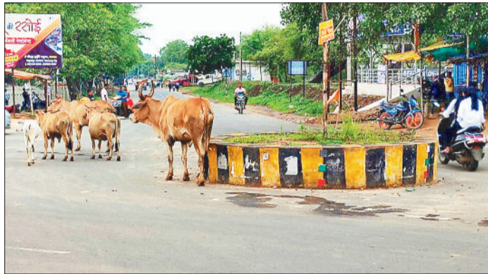
खरवत चौहारे पर मवेशियों का डेरा।

दिन में आवागमन करने वालों को सड़क सिर्फ शाम ढलने के बाद शहर क्षेत्र के