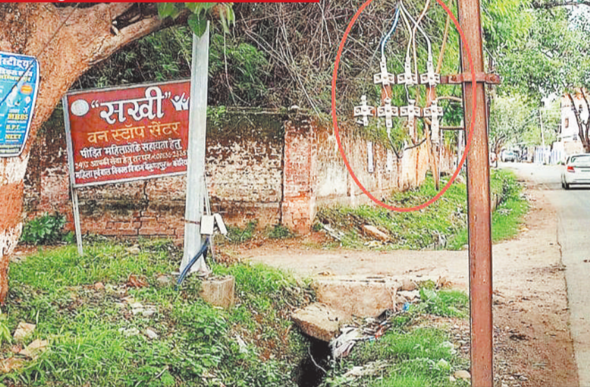
बैकुण्ठपुर। शहर के महलपारा मुख्य मार्ग पर स्थित विद्युत खंभे पर हादसे का खतरा मंडरा रहा है। विद्युत विभाग की लापरवाही से कभी कोई भी मौत के मुंह में समा सकता है। इस और विभाग को तत्काल ध्यान दिव जाने की जरूरत है।